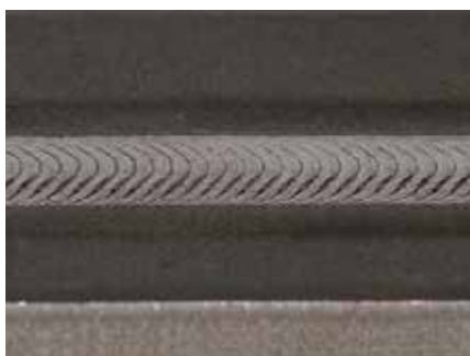
Soudage plasma du titane