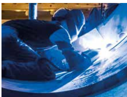
Soudage TIG de l'inox