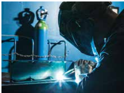
Soudage MIG de l'aluminium

La solution gaz de protection haute performance pour les soudages TIG, MIG et PLASMA de tous les matériaux