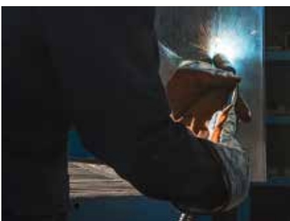
Soudage toutes positions