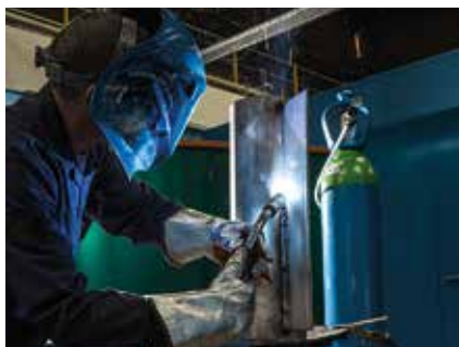
Soudage MAG de l'inox

La solution gaz de protection haute performance pour le soudage MAG de tous les aciers inoxydables