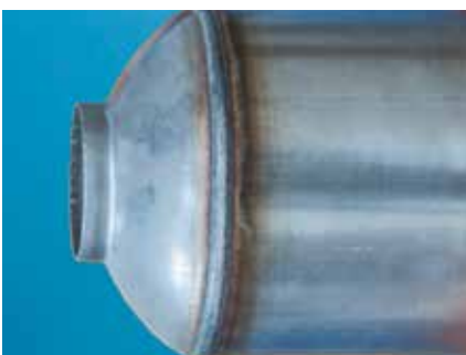
Pot d'échappement en inox ferritique