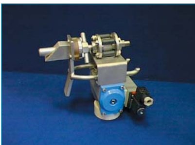
Le CARBOSPRAY B : la solution cryogénique pour malaxeur